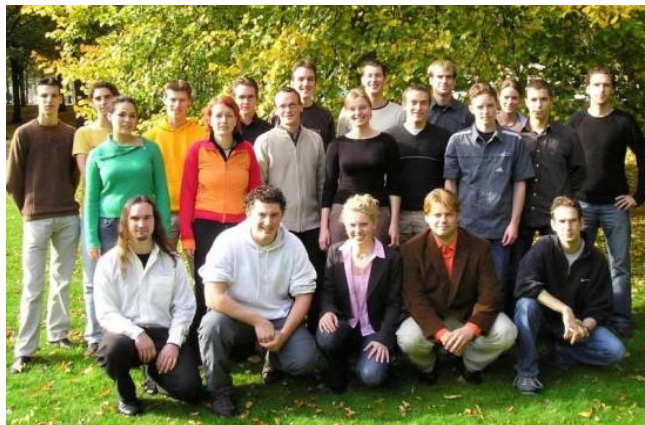
Kandidaten Universiteitsraadverkiezingen 2004 van de Fractie PF

Het beste aanspreekpunt is in veel gevallen de commissaris onderwijs van jouw studievereniging. Daar kun je ook terecht met vragen over de studenteninspraak bij jouw opleiding en faculteit. Met vragen over of kritiek op het beleid van de universiteit kun je uiteraard ook terecht bij de PF ( PF@tue.nl ).